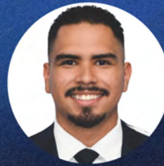
Por: Eric Herrera , Director Regional Departamento de Alabanza & Adoración

Entendí que estos jóvenes en ningún momento le pidieron al Señor que apagase el fuego. Aprendí que las tribulaciones son formas de auto examinar nuestra fe en Cristo Jesús. Es fácil orar y dar palabras de consuelo a las almas pasando tribulaciones diciendo “Confía en el Señor”, pero qué difícil es ponerlo en práctica. Qué difícil es estar tranquilo cuando no vez una salida. Qué difícil es estar tranquilo cuando vez que calentaron el horno sietes veces. Pero tranquilo. Éxodo 14:14 dice “Jehová peleará por vosotros,